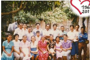
Nuevo Cuscatlán (El Salvador)