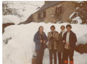
1973 - Azet (Francia)