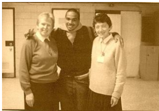
Nueva York (E.E.U.U.)

El 1° de diciembre de 2013, nuestra Fraternidad de las Hermanitas del Evangelio celebrará su 50° aniversario de fundación.