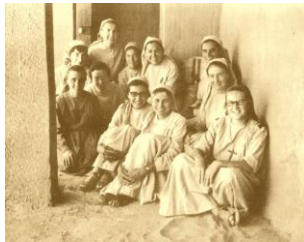
1972- Noviciado, Beni Abbès (Argelia)