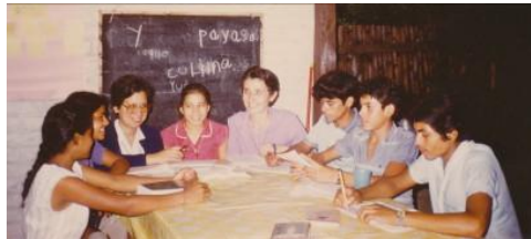
Nuevo Cuscatlán (El Salvador)

Gracias también por su fiel amistad y su generosidad que nos han acompañado y siguen acompañándonos hoy día.