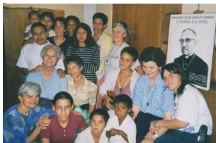
Los Teques (Venezuela)