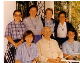
Reunión regional de « las Américas »