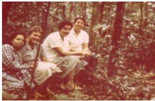
1969 - Santa María (Venezuela)