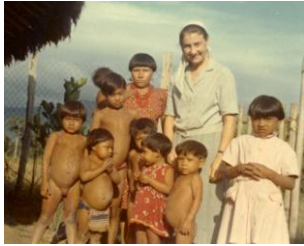
1965 - Santa María (Venezuela)

1963-2013 : 50 años de la Fundación de las Hermanitas del Evangelio