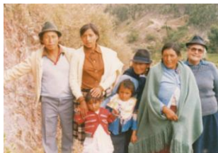
La Inmaculada (Ecuador)