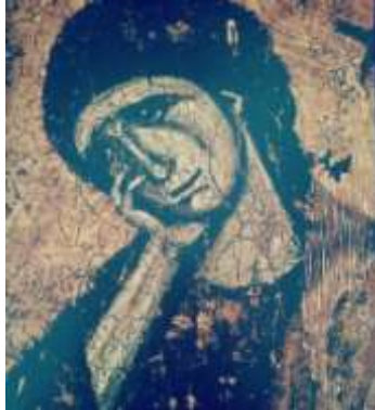
Marie au pied de la Croix de Jésus

Pâques approche : avec l'espérance du Renouveau et de la Résurrection .