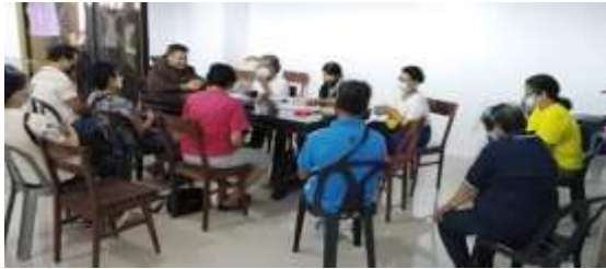
Rencontre mensuelle à Navotas