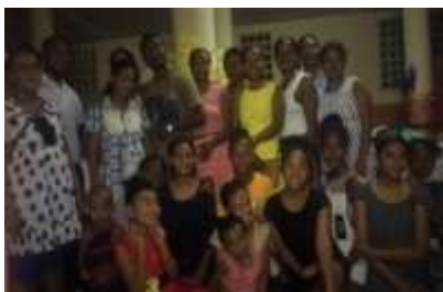
Fraternité de Majunga – Madagascar