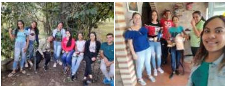
Fraternité des Jeunes Amis de Charles de Foucauld de Bojó

Fraternité des Jeunes Amis de Charles de Foucauld Bojó du Venezuela