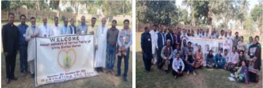
Fraternité séculière et fraternité des prêtres

Cette Assemblée nationale a réuni 51 participants. Les participants étaient membres des Fraternités sacerdotales et des Fraternités séculières de l'archidiocèse de Karachi, de l'archidiocèse de Lahore, du diocèse de Faisalabad, du diocèse de Multan et du diocèse de Rawalpindi.