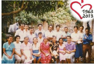
Nuevo Cusaltan (El Salvador)