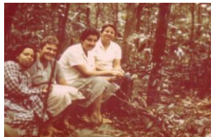
1969 - Santa Maria (Venezuela)