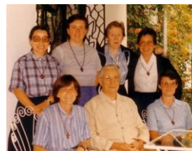
Rencontre de la région Amériques