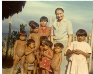
1965 - Santa Maria (Venezuela)

1963 - 2013 : 50 ans de Fondation des Petites Sœurs de l'Évangile