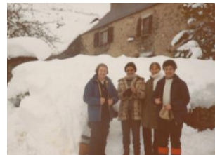
1973 - Azet (France)