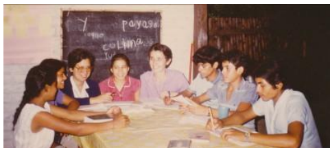
Nuevo Cuscatlan (El Salvador)