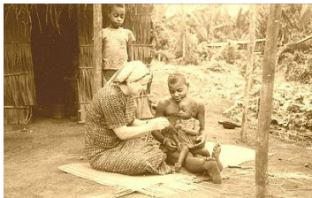
1973 Salapoumbé (Cameroun)