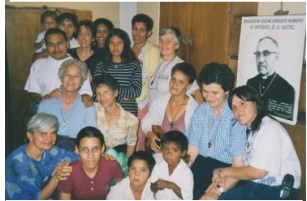
Los Teques (Venezuela)

Oui, les Petites Sœurs devaient découvrir peu à peu que l'Evangélisation n'était pas une tâche parmi