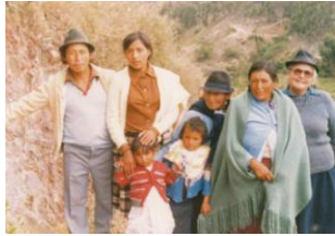
La Immaculada (Equateur)