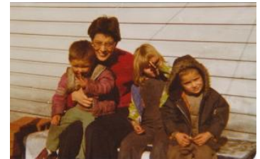
1977 Cawood (Etas Unis d'Amérique)

Dans la joie et l'action de grâce pour cette année jubilaire, les Petites Soeurs de l'Évangile vous souhaitent, jour après jour, une très belle année 2013 !