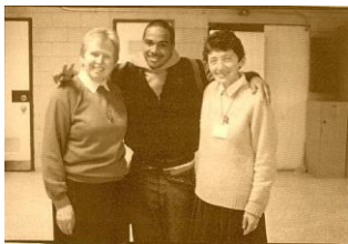
New York (U.S.A.)