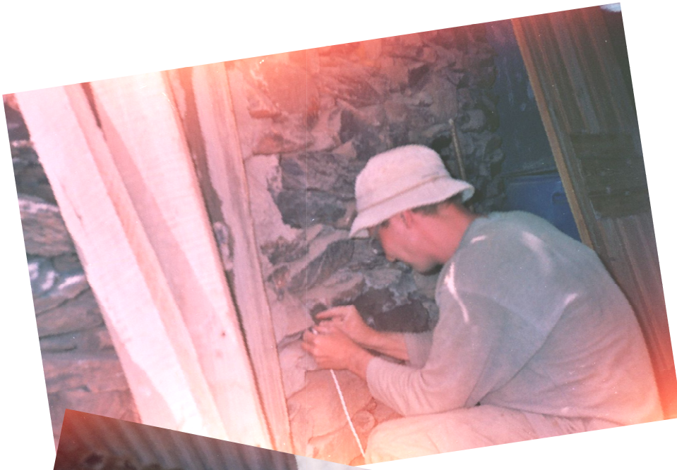
Il y aura même l'électricité !!