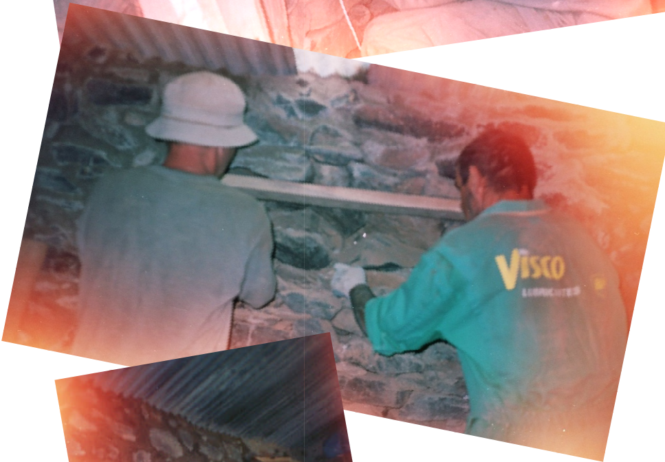
Pose d'une fenêtre