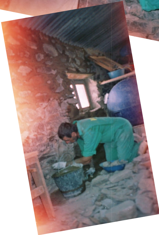
Ventura fignole le crépi