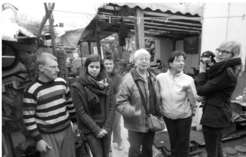
Met twee studenten op huisbezoek bij Roemenen...

met de negatieve beslissingen vanwege de Belgische Staat vb families met kinderen die hier hun leven opgebouwd hebben en na 15 jaar verblijf in België een uitwijzing krijgen. Een procedure 15 jaar laten aanslepen is werkelijk onverantwoord.